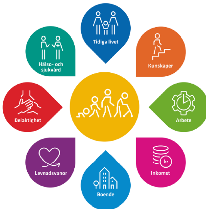
Figur 1. Regnbågsmodellen över hälsans bestämningfaktorer. Dahlgren & Whitehead 2007/1991.

För att uppnå en god och jämlik hälsa finns olika arbetsområden att beakta och utveckla, se bilden nedan.