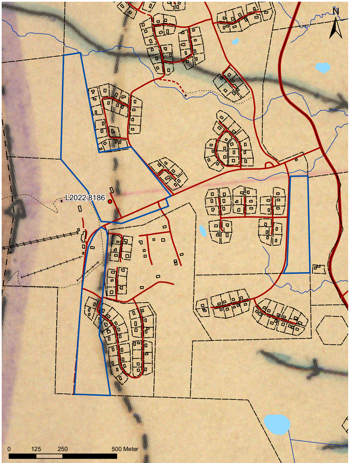
Figur 3. Utsnitt från karta över Särna och Idre socknar från 1919 (20-säa-203) rektifierad mot fastighetskartan med stigen som en streckad linje, utredningsområdena markerade med blå linjer och rösningen L2022:8186 med en röd punkt. Skala 1:10 000.