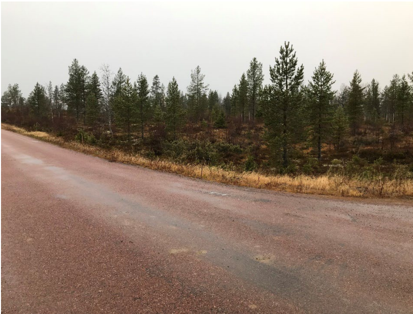
Foto 1. Centrala delar av utredningsområdet fotograferat från sydöst.