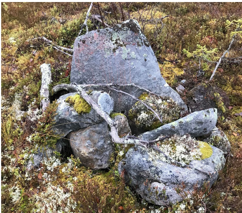
Foto 2. Rösningen L2022:8186 fotograferad från norr.